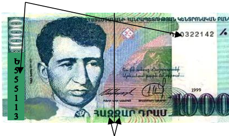
Разорваны и приклеены части разных банкнот

Неплатежеспособными являются и не подлежат обмену монеты, не сохранившие целостность и монеты, части которых отделены друг от друга.