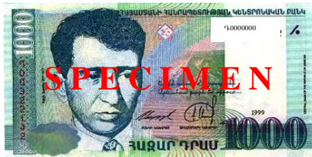
Банкнота с надписью “ОБРАЗЕЦ”